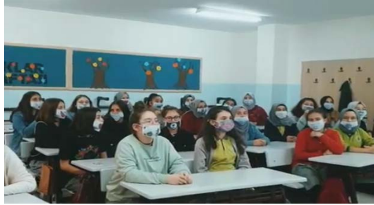
2-8 Kasım Lösemili Çocuklar Haftası