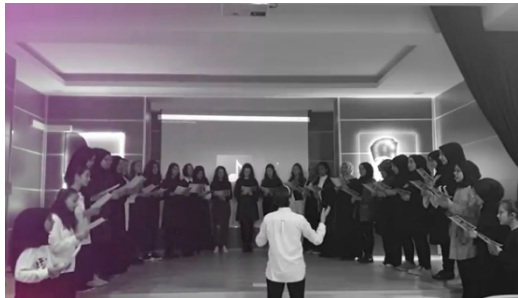
10 Kasım Korusu